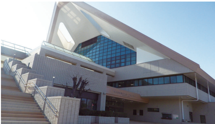
稲永スポーツセンター 名古屋市港区野跡5丁目1-10